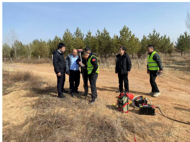
近日，一九四公司承担的小保当一号煤矿15盘区水文地质专项勘探项目第二阶段工作顺利开工。

公司领导班子成员、全体中层干部及各党支部班子成员参加会议。 文/李浩哲