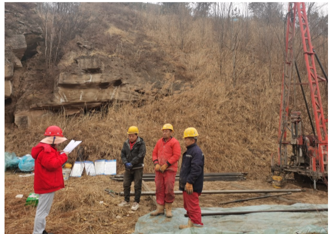
近日，公司子长项目部承揽的延安地区子长市甄家沟、南家咀、天任、前进4座煤矿隐蔽致灾因素普查项目，有序推进并取得阶段性重要成果。