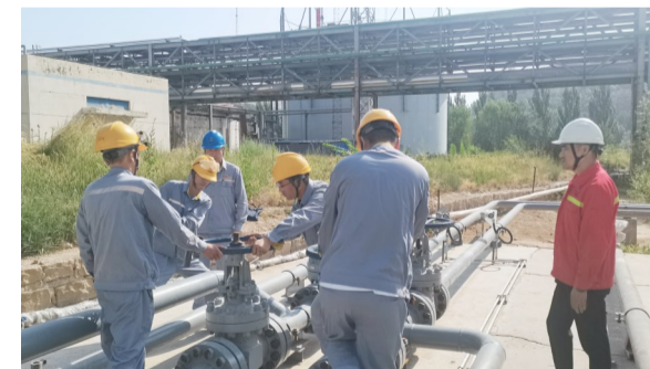
文/田笑宁

6月26日，公司庆祝中国共产党成立103周年大会上表彰了2023年度优秀通讯员。