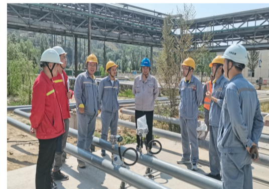
文/畅双涛

近日，公司施工的新建一对采卤盐井及原始地质技术资料顺利通过了陕西金泰氯碱化工有限公司验收。