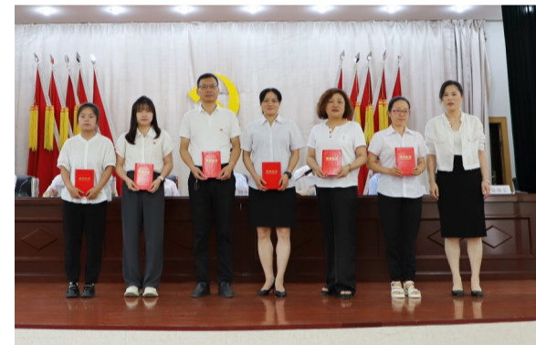
文/田笑宁

6月26日，公司庆祝中国共产党成立103周年大会上表彰了2023年度优秀通讯员。